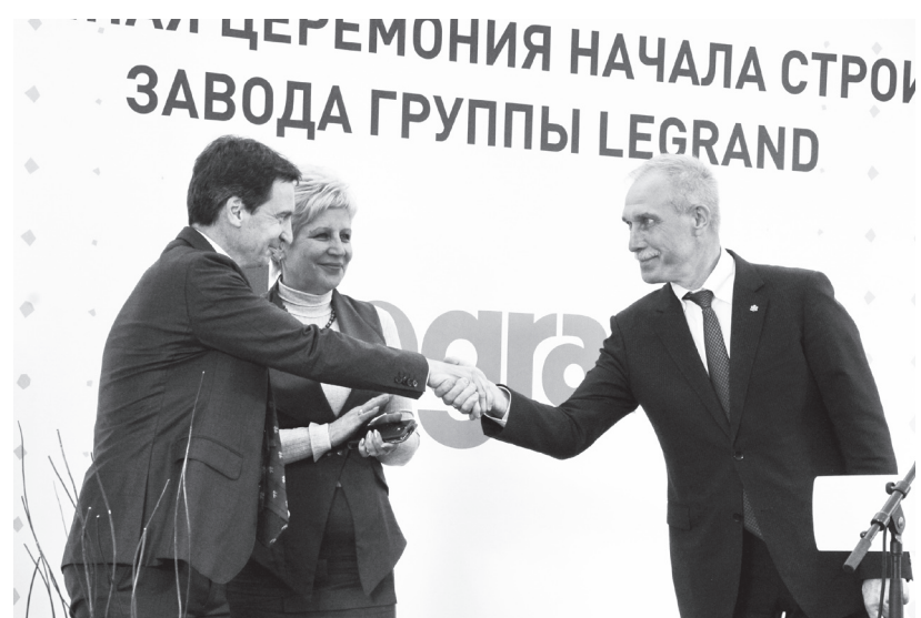
11.05.2017. Промзона «Заволжье». Закладка первого камня в строительство нового завода Legrand. В 2007 году французская группа компаний Legrand приобрела около 95% акций ОАО «Контактор». В 2014 году в промзоне «Заволжье» под нужды компании был модернизирован существующий корпус (инвестиции составили около 600 млн руб., было создано 250 новых рабочих мест). Тремя годами позже в том же «Заволжье» началось строительство нового корпуса. Сюда переедут производственные мощности и складские помещения из здания «Контактора» в центре Ульяновска (кроме испытательного центра). Вложения составят более миллиарда рублей, обещают создать не менее 300 новых рабочих мест. После принятия решения о старте еще одного проекта - речь идет о литейном производстве в Чуфарове Вешкаймского района - Legrand догоняет американскую Mars, Inc., построившую в Ульяновской области две фабрики, цех и научный центр.

Также в рамках совещания пять IT-компаний Ульяновской области присоединились к меморандуму об ответственном ведении бизнеса: ООО «Кули батон», ООО «Группа компаний ИТМ», ООО «Медиа-софт», ООО «Симбирсофт», ООО «SEO-поисковая оптимизация». Напомним: с такой инициативой выступила Ассоциация развития информационных технологий ре-